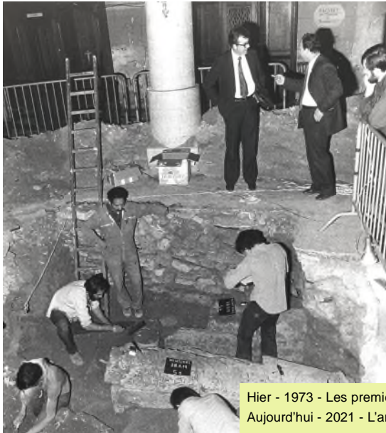
Hier - 1973 - Les premières fouilles archéologiques à Nanterre Aujourd'hui - 2021 - L'archéologie sur le site internet de la SHN

En 2020, sur notre site internet, des images des fouilles archéologiques par l'INRAP, à la recherche des caves du Collège Royal dans le parc des Anciennes-Mairies.