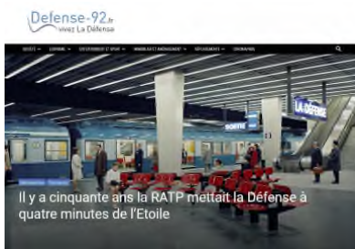
Il y a cinquante ans la RATP mettait la Défense à quatre minutes de l'Etoile