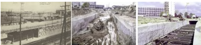
La Folle - gare et camp militaire

Toujours à déguster en ligne, en attendant que nous reprenions nos manifestations publiques et nos visites sur le terrain, voici un dossier mis en ligne en février dernier par son auteur, Adrien Teurlais, sur son site Internet Défense-92.fr , à l'occasion du cinquantième anniversaire de la construction de la ligne A du RER.