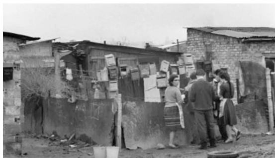
Des habitants viennent retirer leur courrier aux boîtes aux lettres du bidonville de Nanterre.