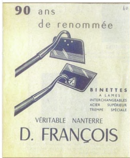
La binette de Nanterre au catalogue du BHV de 1959.