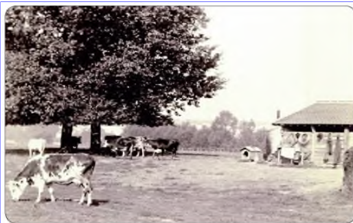
A quel endroit paissaient encore ces vaches nanterriennes au siècle précédent?

En novembre 2021, la « Ferme Géante » s'installe à nouveau comme traditionnellement dans le centre de Nanterre.