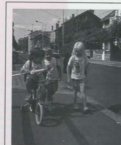
La rue Victor-Hugo reliant la rue Rigault à la rue de Courbevoie suit le tracé du chemin des Colombiers.