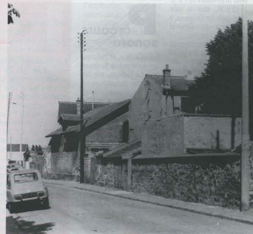
A l'emplacement du gymnase Victor-Hugo (entrée rue Marcellin-Berthelot) l'une des dernières fermes de Nanterre (photo J. et R. Cornaille, vers 1968).