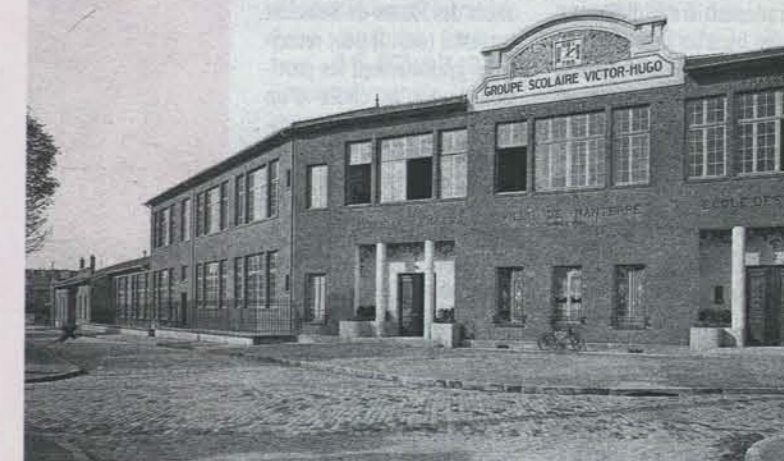
5939. NANTERRE - La Rue Victor-Hugo - Le Groupe Scolaire EM