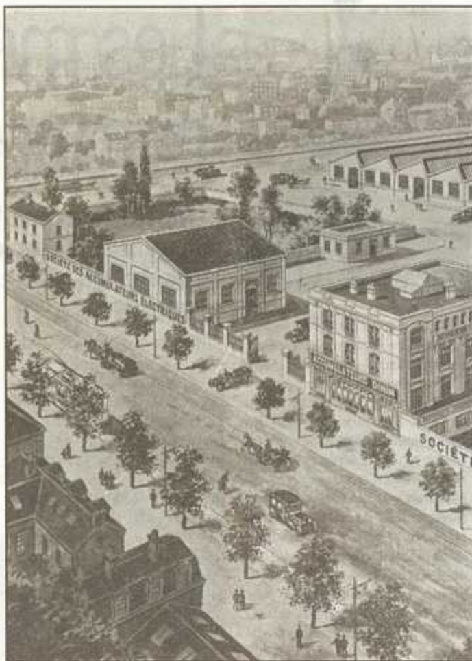
Les usines de Nanterre de la Société des accumulateurs électriques route de Cherbourg (actuelle avenue du Maréchal-Joffre).