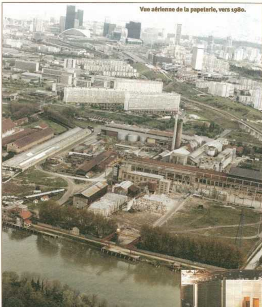
Vue aérienne de la papeterie, vers 1980.

mondial de carton ondulé et de papier à base de vieux papiers recyclés, ayant racheté la branche papier bois de Saint-Gobain.