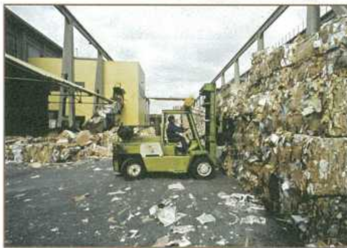
Les vieux cartons dans leur aire de stockage.

(face à l'université, le long de l'A 86). Attention ! Visite impossible pour les enfants de moins de dix ans.