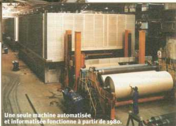
Une seule machine automatisée et informatisée fonctionne à partir de 1980.

Rachetée par son principal client, le groupe Socar (groupe Saint-Gobain) en 1987, la papeterie de la Seine devient en 1994, un établissement de Smurfit-Socar, le groupe irlandais Jefferson Smurfit, premier producteur