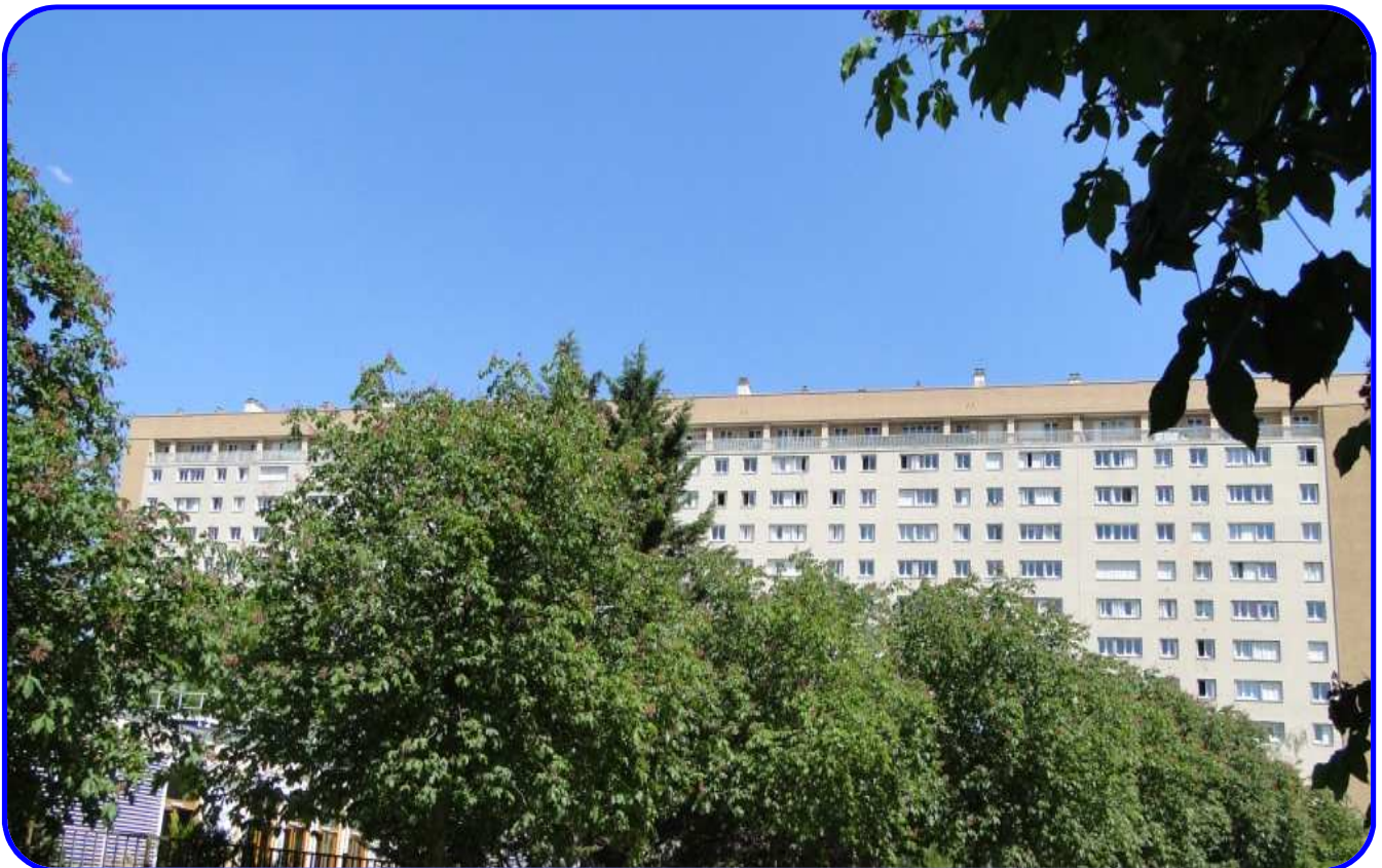
Immeubles de la cité Anatole-France, construits à partir de 1953 / architecte : Bernard Zehruss.