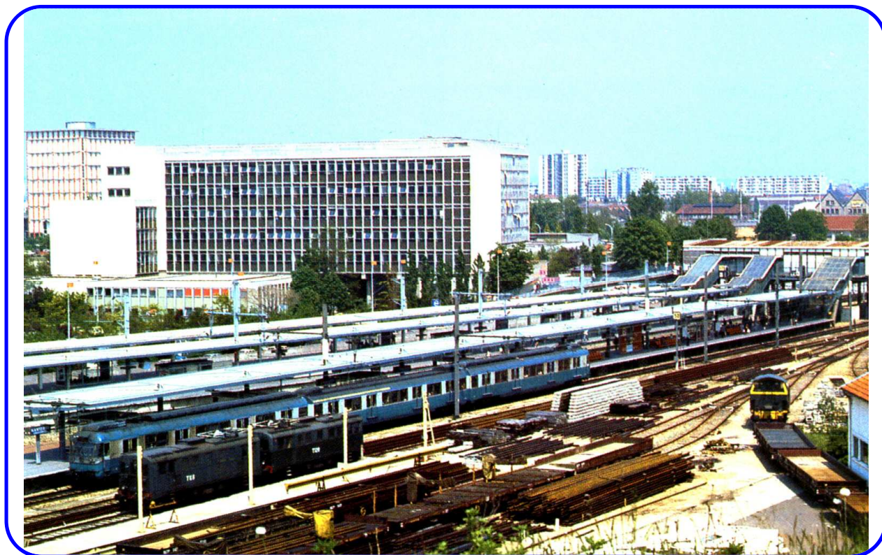
Photo du haut représentant le camp de la Folie au temps du camp d'aviation, celle du bas la Gare de Nanterre Université fin des années 1970.