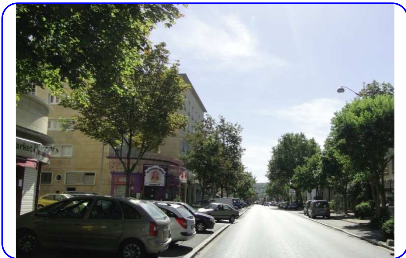
Les deux photos représentent le boulevard National en 1950 et en 2012