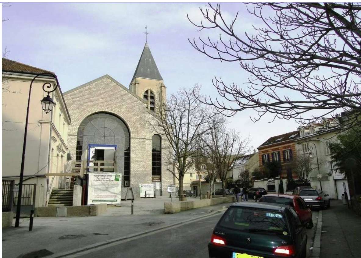
La rue de l'Eglise et le parvis au début du XXème siècle et la cathédrale Ste Geneviève en mars 2013.