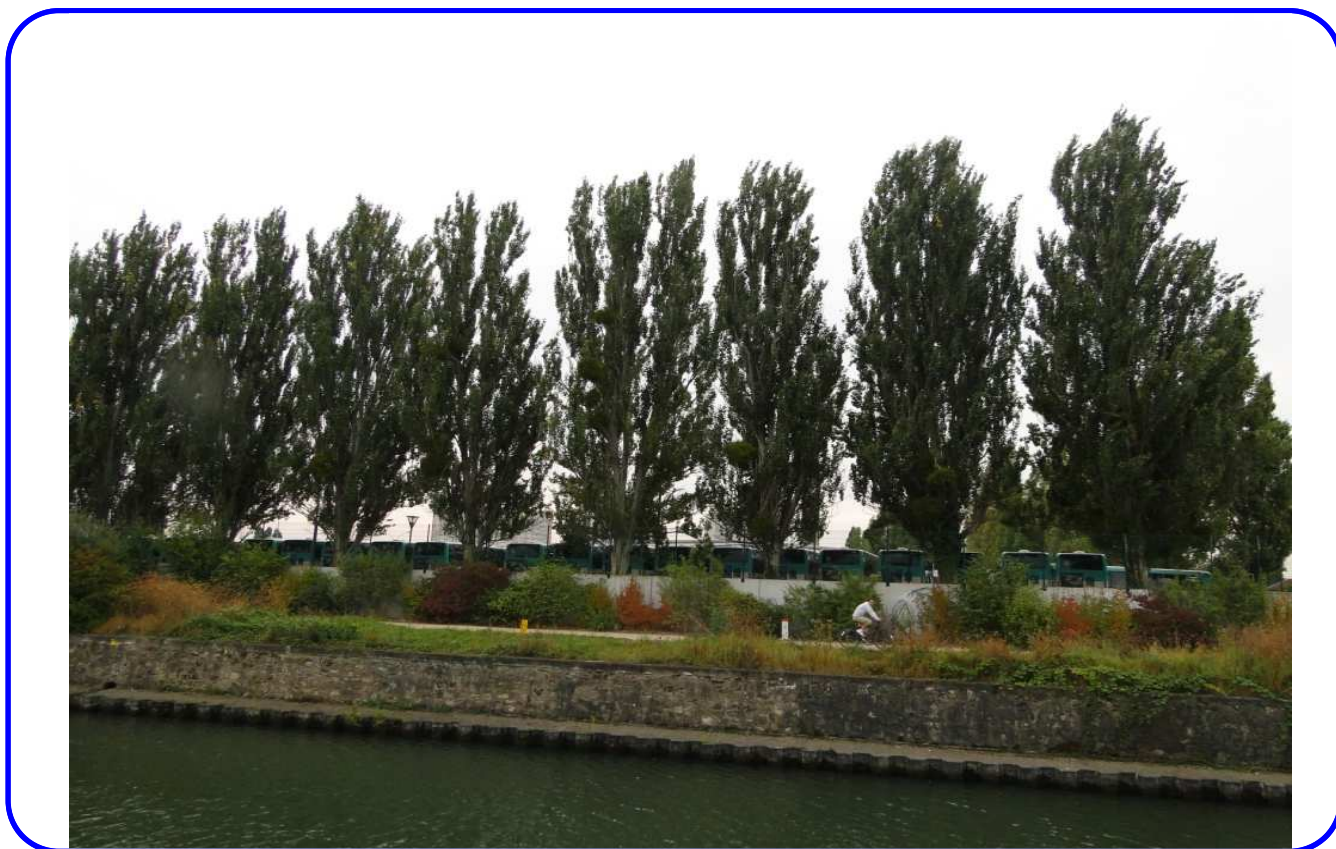
Berges de la Seine au même endroit : l'Usine à Gaz au début du 20 ème siècle... et le dépôt des bus de la RATP en 2012