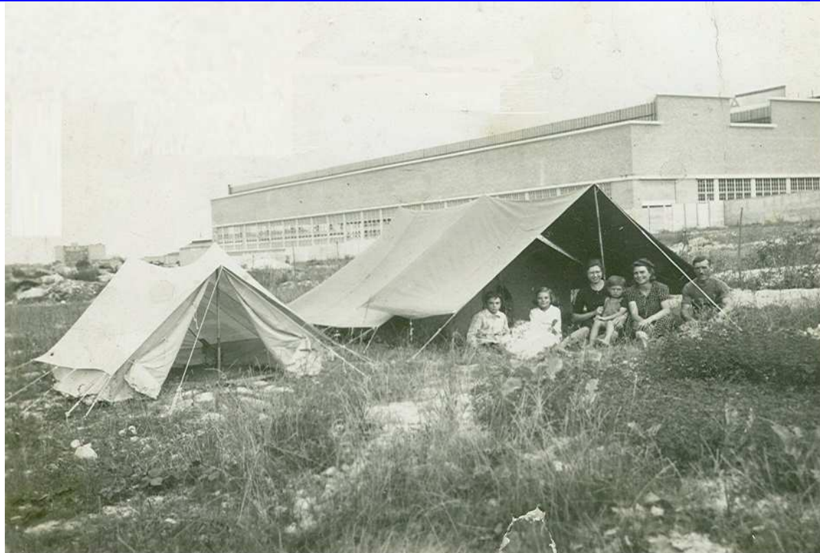
L'usine Simca en 1950.

Comme ce sont les vacances, notre rubrique hier / aujourd'hui fait du camping. A Nanterre. Aux Fontenelles ! Vers la rue Diderot (Montesquieu, aujourd'hui).