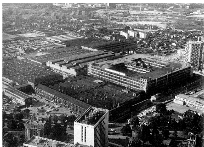
La même, devenue Citroën, en 1970.