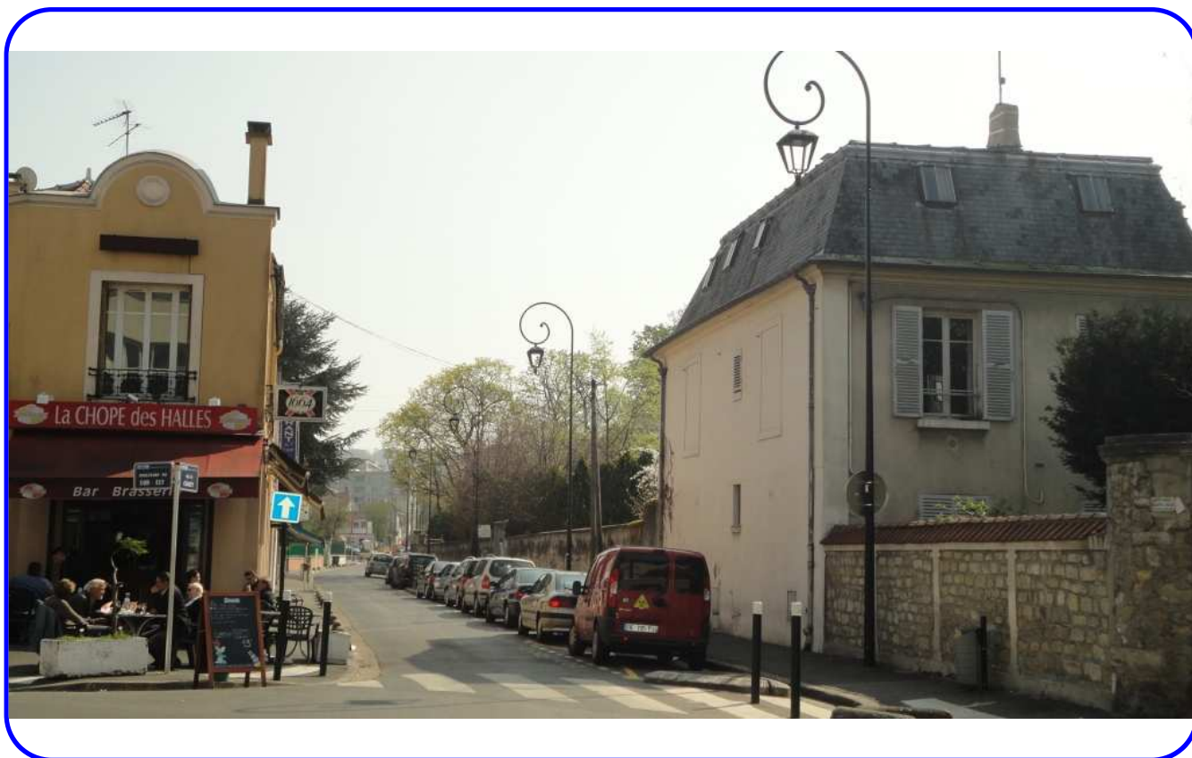
Angle de la rue de Chanzy et du boulevard du Sud-Est (carte postale ancienne et photo 2012).