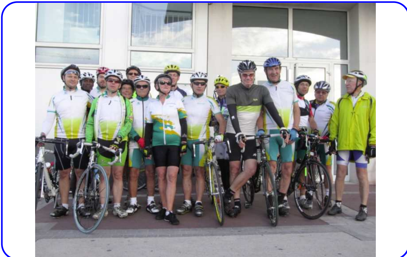
Coueurs cyclistes d'hier (années 1930) et cyclotouristes de l'ES Nanterre d'aujourd'hui, place de la Boule, avant l'effort