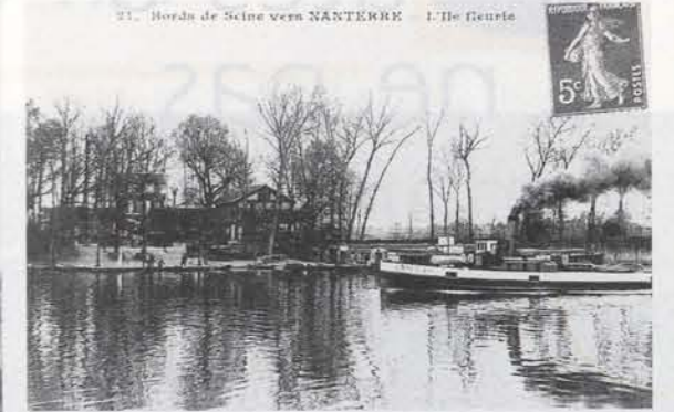
11. Bords de Seine vers NANTERRE. L'île Genevieve