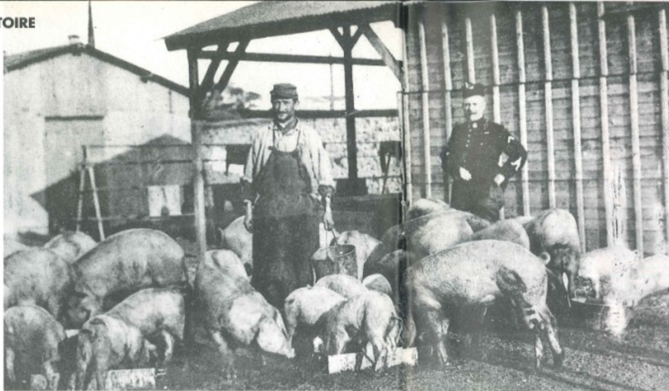
Le « porcherie modèle » du centre d'aviation de Nanterre.