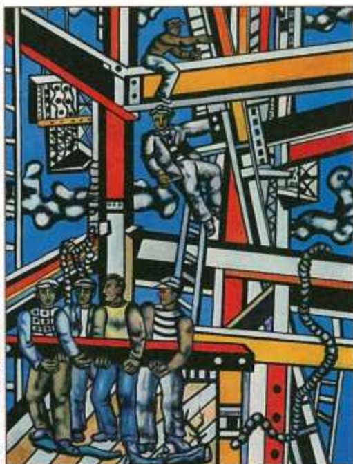
Exposition, quelques jours avant l'inauguration du théâtre, d'œuvres de Fernand Léger, dont « Les Constructeurs ».

La Maison de la Culture définitive prendra le relais du Théâtre de Nanterre en 1976; la ville sera enfin dotée d'un outil de travail moderne et de qualité, pièce maîtresse de l'action culturelle, qui permettra le travail d'une équipe et l'élaboration d'actions communales.