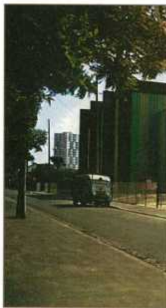
Le théâtre de Nanterre était situé au niveau actuel de l'hôtel-restaurant l'Amandier.

P ressentie pour devenir la future préfecture des Hauts-de-Seine, Nanterre abrite déjà en 1965 une faculté de lettres et de sciences humaines et espère accueillir, dans le cadre de l'aménagement de La Défense, de grandes institutions culturelles.