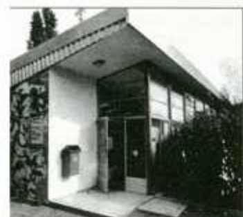
La première bibliothèque du Petit-Nanterre a été créée en 1963.