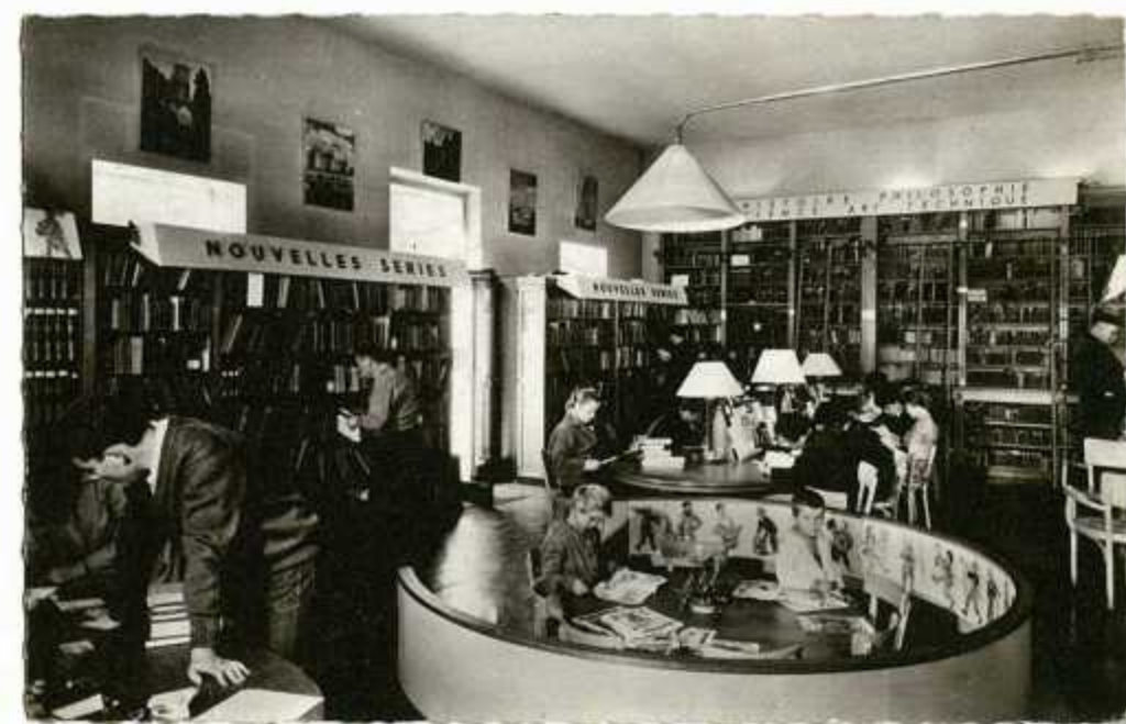
Vue de la bibliothèque centrale de Nanterre en 1960 ; à partir de 1975, elle devient bibliothèque de quartier sous le nom de Flora-Tristan.

En 1902, la bibliothèque populaire installée à l'école des garçons, 11, bd du Midi, est ouverte tous les mardis et vendredis de 20 heures à 21 heures. Le directeur de l'école des garçons s'occupe de l'accueil et de la tenue des fichiers. Sur les 7184 vo-