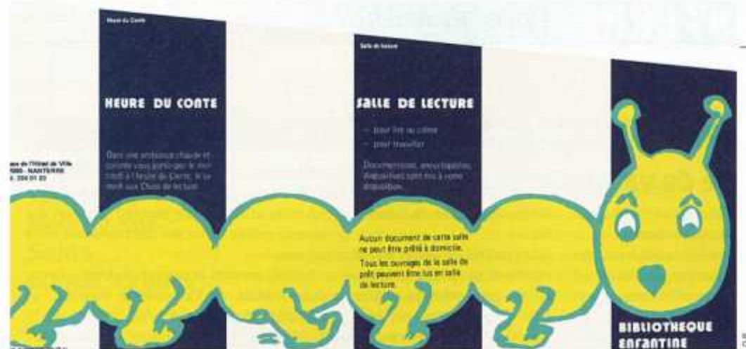
Dépliant de 1976, concernant la bibliothèque enfantine Pierre-et-Marie-Curie.