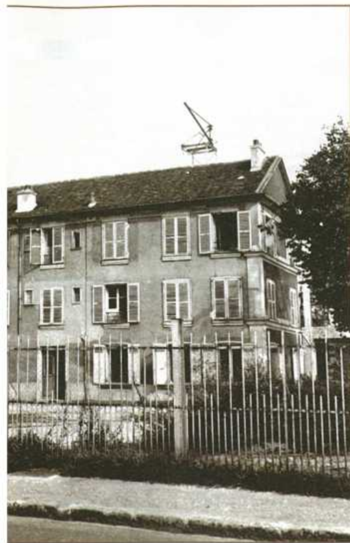
La fonderie de précision ALUVAC s'installe en 1925 au 32, bd National, dans une ancienne fabrique de colle.

te, souvent, il s'arrête pour demander à une maman se promenant avec son enfant de cinq à dix ans, où se trouve le meilleur marchand de jouets. En souvenir, il laisse une auto à l'enfant, qui devient son premier client. Il visite lui-même la clientèle, pour connaître ses réactions face à ce produit nouveau.