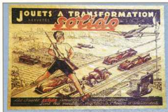
Coffret de jouets Solido.

Un premier catalogue paraît en 1933-1934, sur lequel figurent, en couleurs, les premières voitures de la série « 140 » ou MAJOR et celles de la série « 100 » ou JUNIOR. Elles sont chromées et certaines pièces sont recouvertes de peinture laquée. Les voitures peuvent être vendues à l'unité ou en coffret, le plus luxueux comportant 18 modèles! De nombreuses boîtes à transformation contiennent les différentes pièces, c'est-à-dire les châssis, les roues, les capots, le moteur, les sièges, les carrosseries, que les enfants peuvent associer grâce à des ergots et des vis.