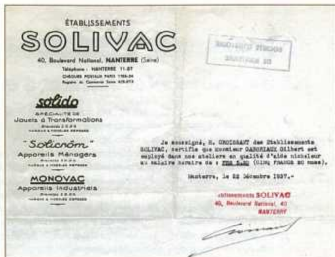
De 1932 à 1938, les jouets Solido sont fabriqués à Nanterre.

bien inspirée en donnant aux siens le nom de Solido. Nous ne sommes plus en présence de pièces embouties; les pièces sont moulées. Mais elles le sont avec une telle précision que les éléments qui les constituent sont interchangeables. À tel point que ce sont des jouets "à transformation"! D'un aéroplane vous faites un bateau, et d'un bateau une auto; et la séance de jeu terminée, l'enfant retrouve dans la boîte un aéroplane! La curiosité de l'enfant qui, autrefois, se traduisait par la casse de son jouet, s'exerce maintenant par son démontage. L'enfant gagne en jouant, un peu d'esprit d'ordre, de sens de la méthode, d'adresse d'ajustage. »