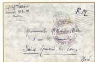
Courrier de l'armée de l'air.

L'Amicale philatélique de Nanterre organise, à l'occasion de ses 60 ans, des journées portes ouvertes sur la lettre, le timbre et la philatélie. Ces journées se tiendront les 19 et 20 janvier 2008, de 9 h à 18 h, dans la galerie des Tourelles, 9, rue des Anciennes-Mairies. Des expositions présenteront les différentes manières de collectionner timbres et lettres, ainsi que les aspects contemporains de la philatélie.