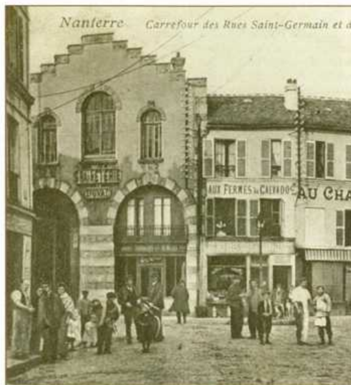
Le bureau de poste télégraphe, rue du Marché, en 1908.

Au fur et à mesure du développement des quartiers, les bureaux de poste vont se répartir sur tout le territoire avec la recette principale, 5, boulevard du Levant, construite en 1977; deux bureaux annexes: rue de Zilina; ouvert le 7 janvier 1975 et déplacé avenue du Général-Leclerc en 1997 et rue des Alouettes, ouvert le 6 janvier 1981; deux bureaux autonomes: au centre commercial Berthelot, déplacé depuis, et avenue Pablo-Picasso. En 1967, après la création des Hauts-de-Seine, Nanterre accueille la direction départemen-