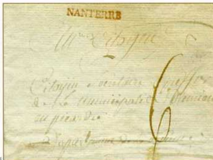
Lettre de 1794, avec marque linéaire.