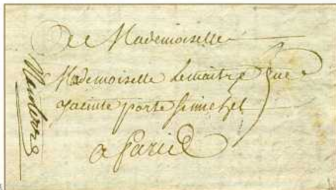
Lettre de 1745, avec marque «Nanterre» manuscrite.

Pour l'avenir, il est permis d'espérer que Nanterre gagne ses lettres de noblesse dans la vie postale française en obtenant, un jour, l'émission d'un timbre-poste.