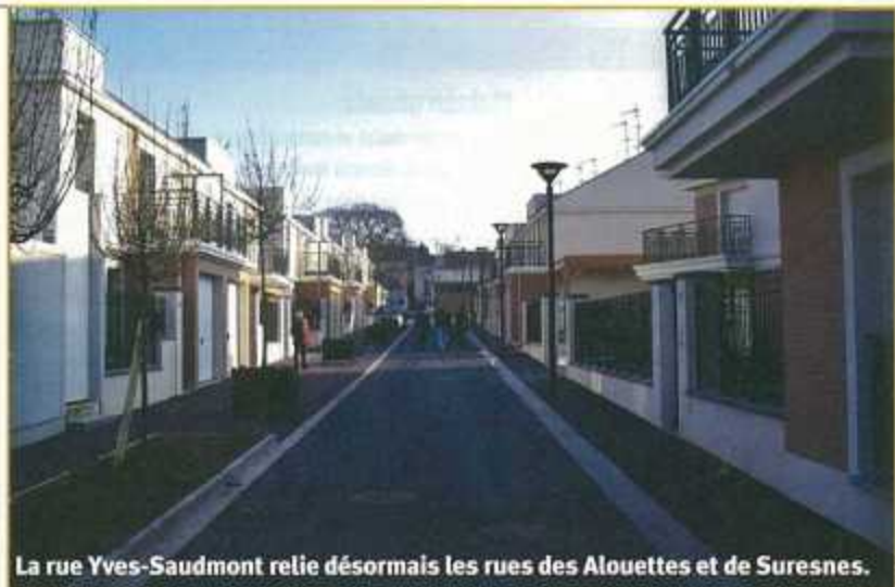
La rue Yves-Saudmont relie désormais les rues des Alouettes et de Suresnes.

Rue des Vignes : par délibération du 28 juin 2005,