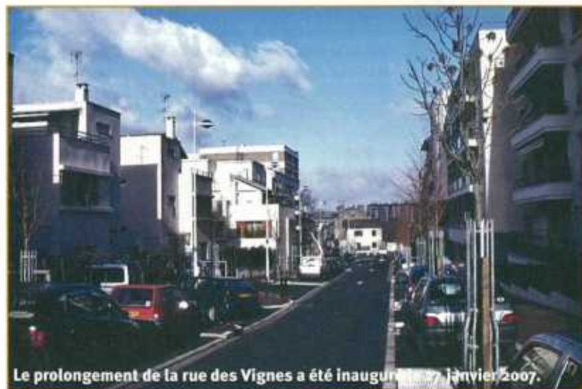
Le prolongement de la rue des Vignes a été inauguré le 27 janvier 2007.

Rue Fernando : un acte de vente d'un terrain de 1 620 m 2 daté du 14 juin 1894 entre Madame