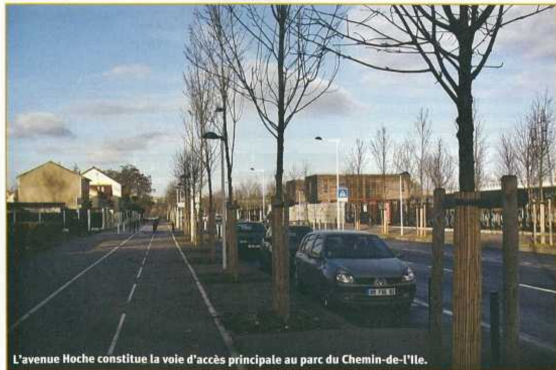
L'avenue Hoche constitue la voie d'accès principale au parc du Chemin-de-l'Île.

* Bulletin n° 36 de la Société d'Histoire, par Claude Léonard, paru en décembre 2005.