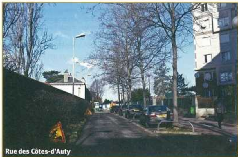
Rue des Côtes-d'Auty

pour tous « les Français musulmans d'Algérie » de la région parisienne. En protestation contre cette mesure,