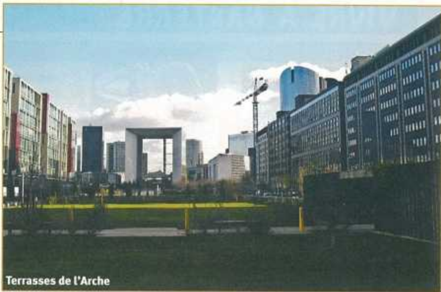
Terrasses de l'Arche

les dirigeants du FLN décident d'organiser une grande manifestation la nuit du 17 octobre, en plein couvre-feu. La répression, par les forces de police sous les ordres de Maurice Papon, sera terrible. Selon les sources, entre 40 et 300 Algériens trouveront la mort. Des dizaines de manifestants seront jetés dans la Seine, tandis que d'autres mourront dans des centres de détention plusieurs jours après leur arrestation. Niée par les autorités de l'époque, l'ampleur du massacre ne sera réellement connue qu'en 1999, lorsque Maurice Papon perdra son procès en diffamation contre l'historien Jean-Luc Einaudi.