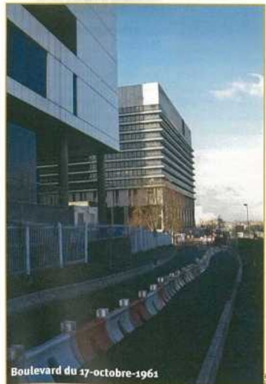
Boulevard du 17-October-1961