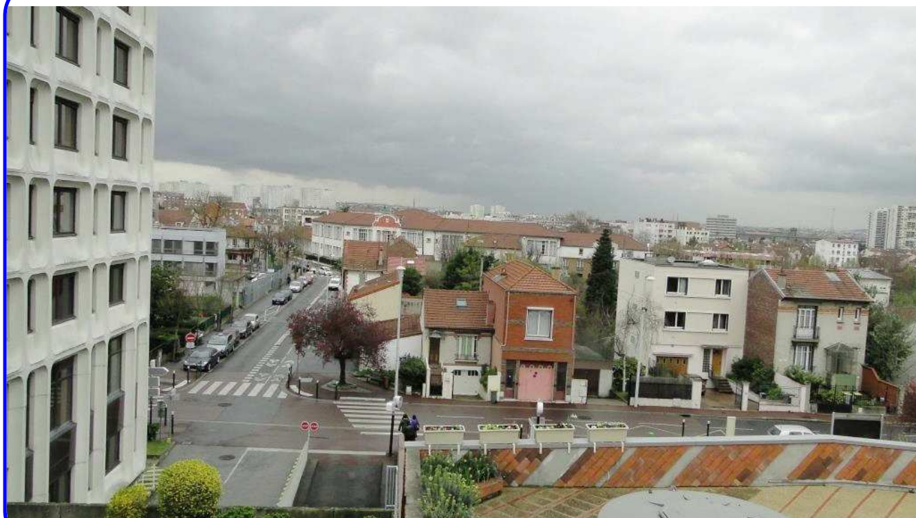
Aujourd'hui, depuis la terrasse de la Médiathèque Pierre-et-Marie-Curie (photo mars 2014).