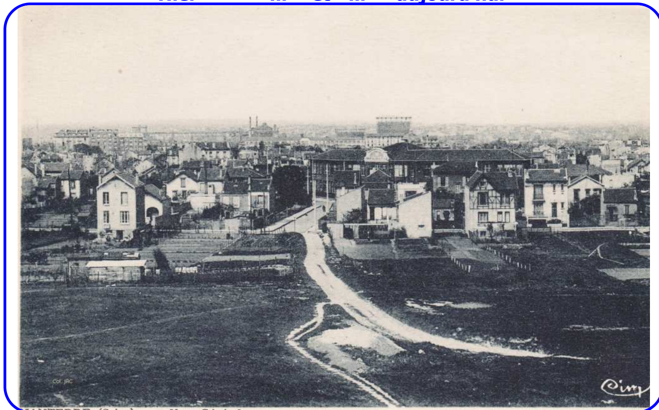
Avant la construction de l'Hôtel de ville, on distingue au deuxième plan la rue d'Asnières (aujourd'hui du huit-mai 1945), le groupe scolaire Victor-Hugo (aujourd'hui collège) et, au fond, l'Usine à gaz (carte postale années 1940).