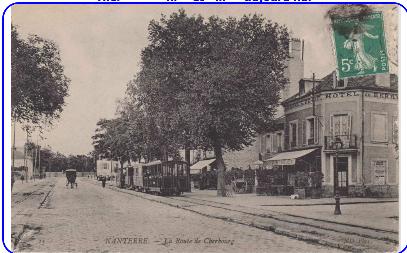
L'Hôtel du Berry, à l'angle de la rue Joseph-Terneau et de l'avenue Joffre, au début du siècle.