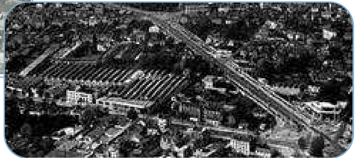
Photo représentant, à l'angle des avenues Joliot-Curie et Georges-Clemenceau, la construction de l'immeuble de La Boule en mai 1959.

A vous de reconnaître le site industriel représenté par ces deux images.