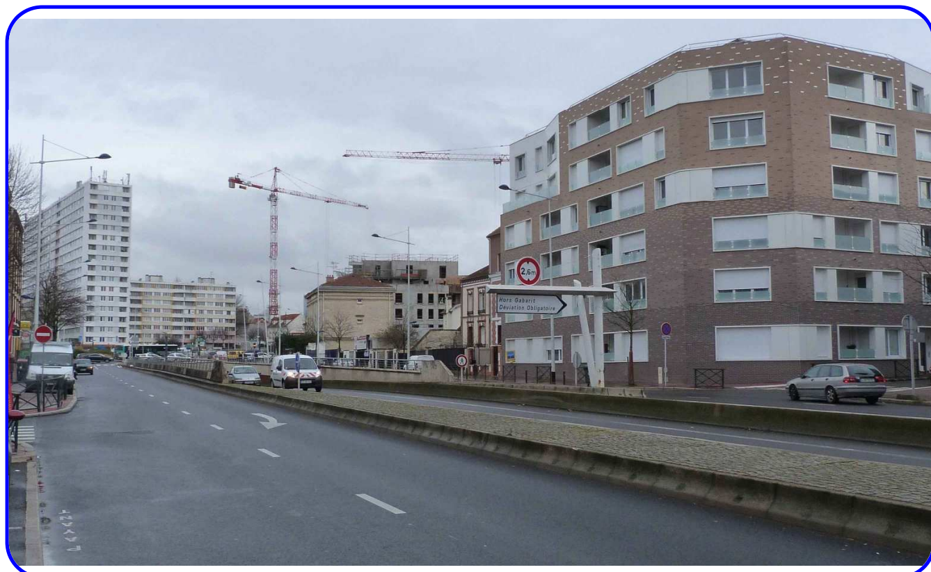
Le même endroit photographié en 2014; l'immeuble a remplacé l'hôtel et le souterrain a remplacé le tramway.