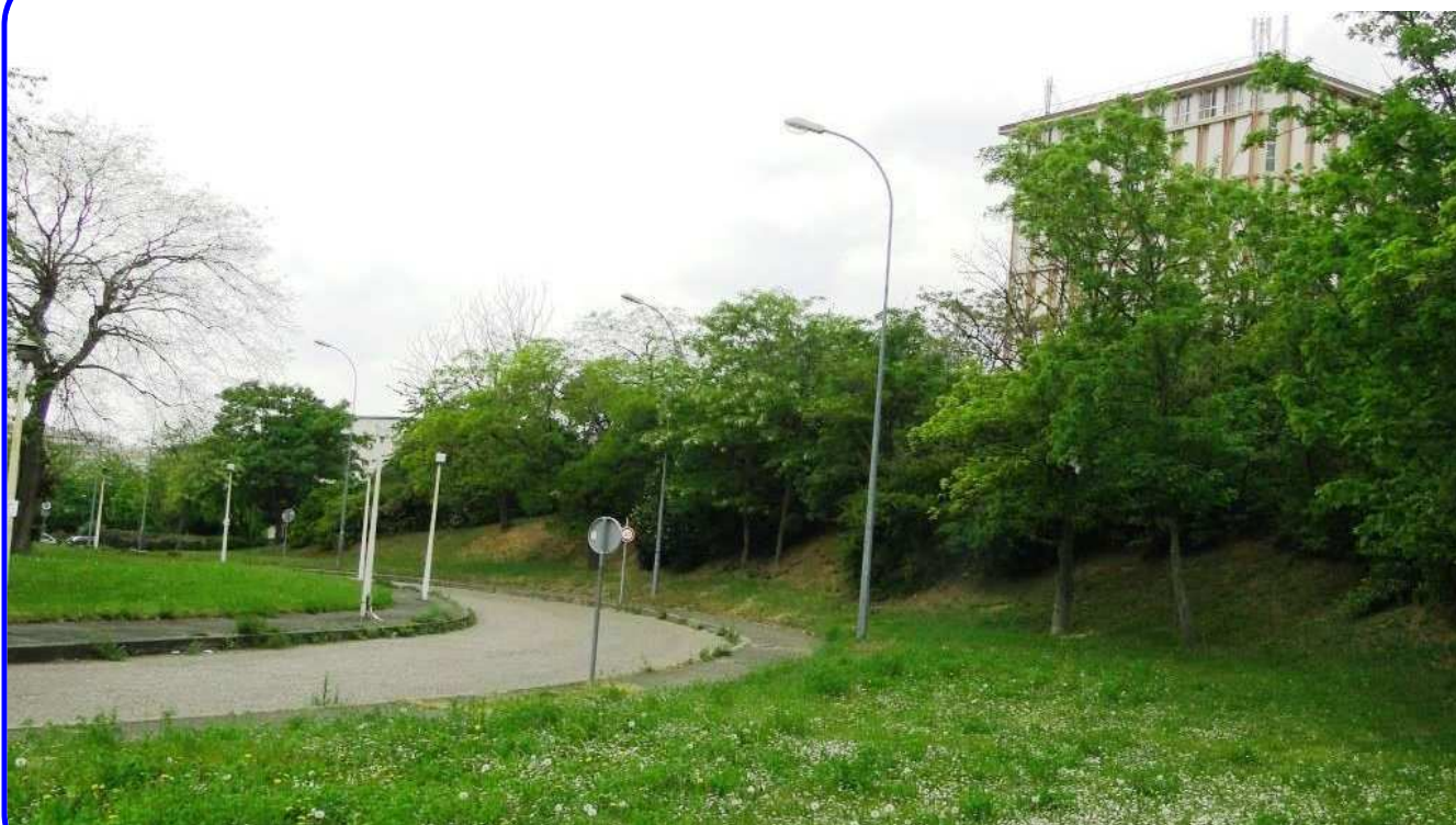
Le même endroit photographié en 2014 ; on y voit, à droite, la tour de la BDIC, où nous avons rendez-vous le 27 juin.