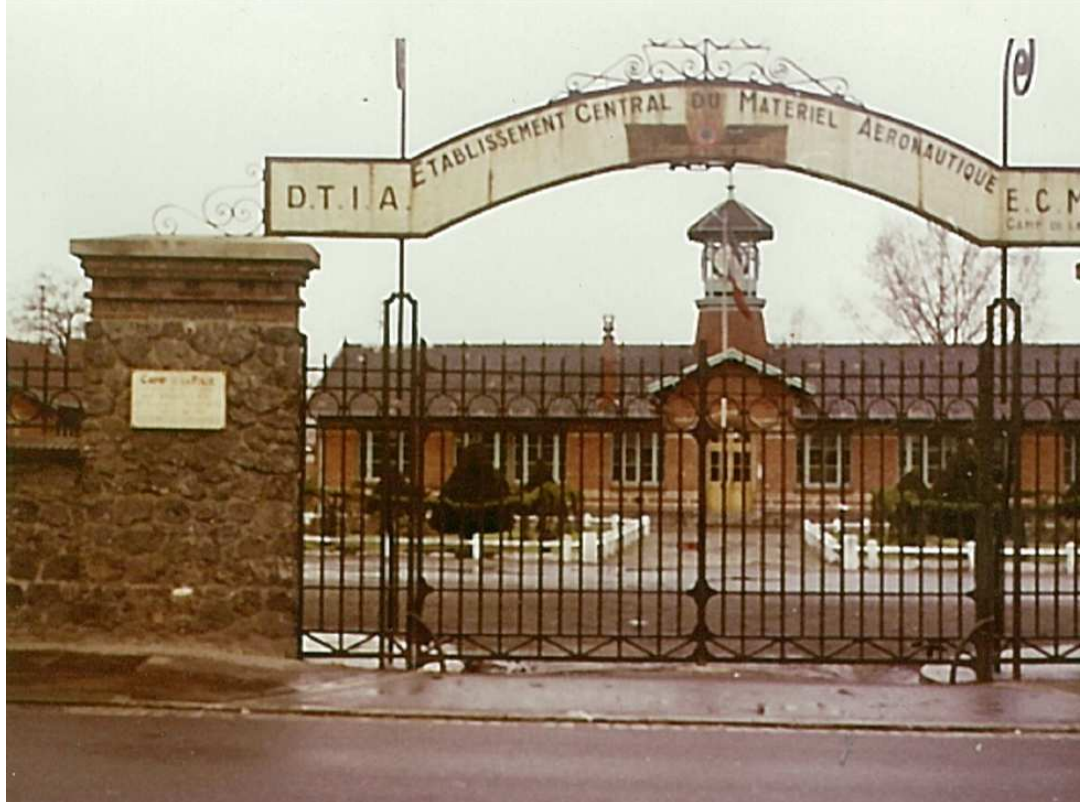
L'entrée du Camp d'Aviation, rue de Rouen, dans les années 1950.