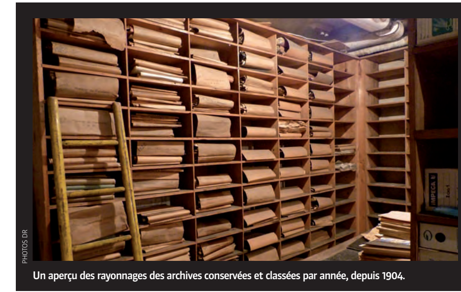
Un aperçu des rayonnages des archives conservées et classées par année, depuis 1904.