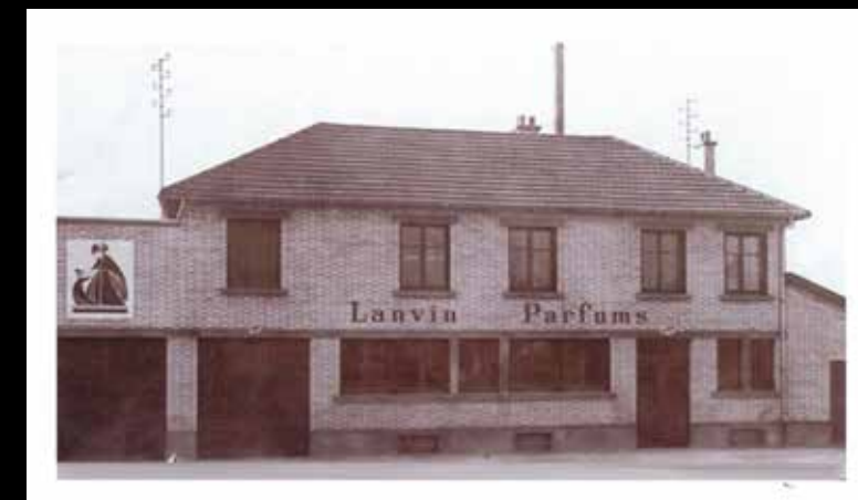
Le laboratoire de parfums Lanvin à Nanterre, 2, rue de Suresnes, en 1925.

Plusieurs parfums de grand renom vont être créés à Nanterre.