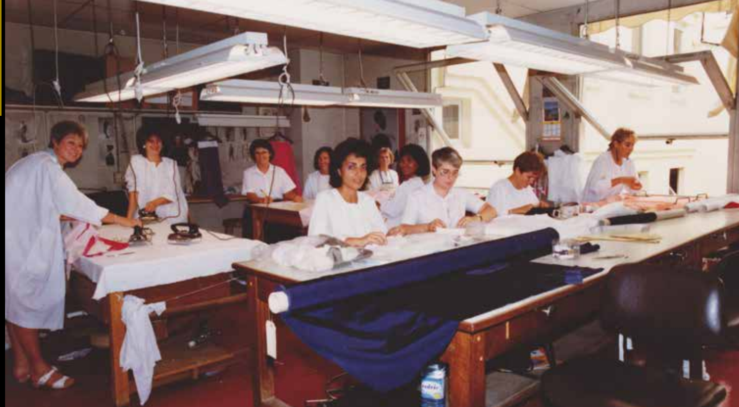
Au premier plan de cette photo de l'atelier de couture Lanvin, un rouleau de tissus «bleu Lanvin» qui vient de la teinturerie de Nanterre.