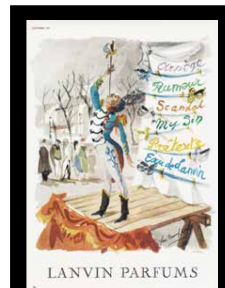
Publicité parue en décembre 1958 qui rappelle les plus prestigieuses créations Lanvin.