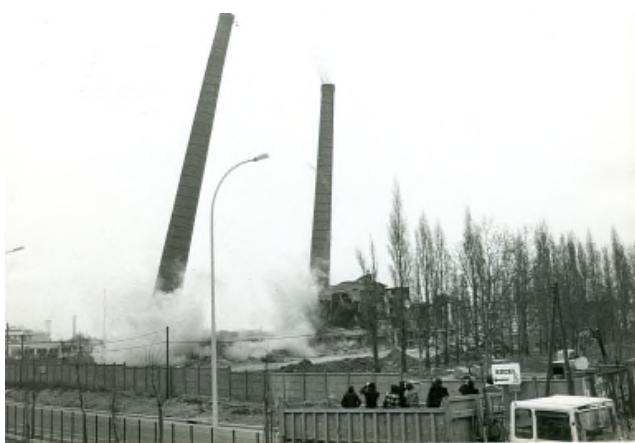
La démolition de «La Rona» en 1982.