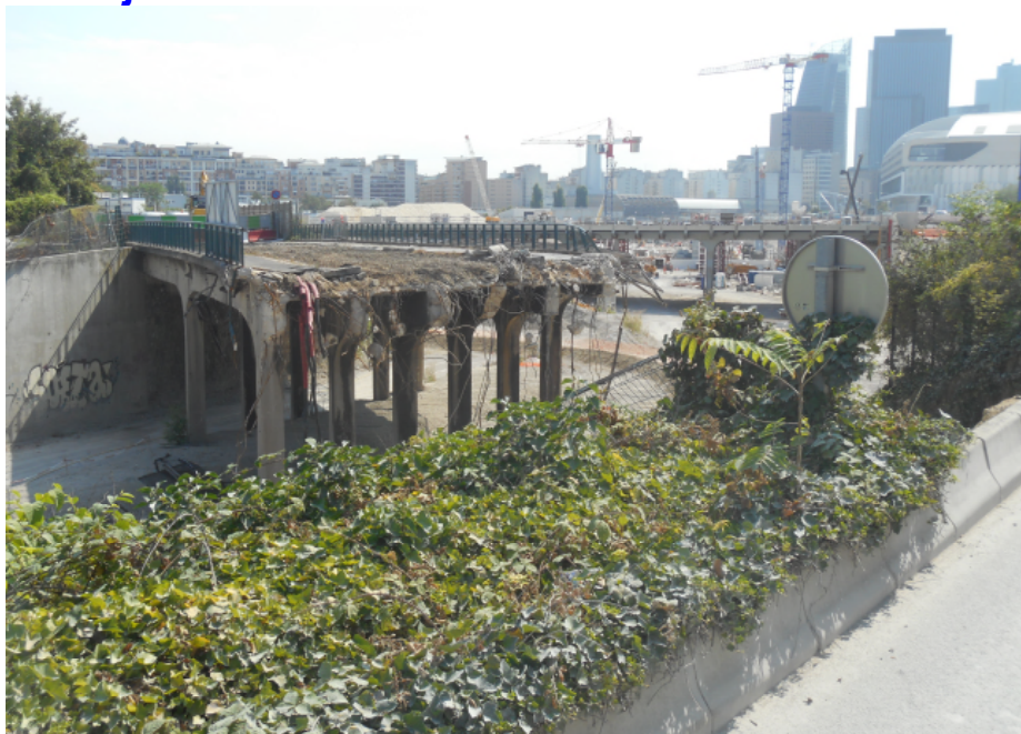
juillet 2018

Il permettait l'accès au quartier des Groues.