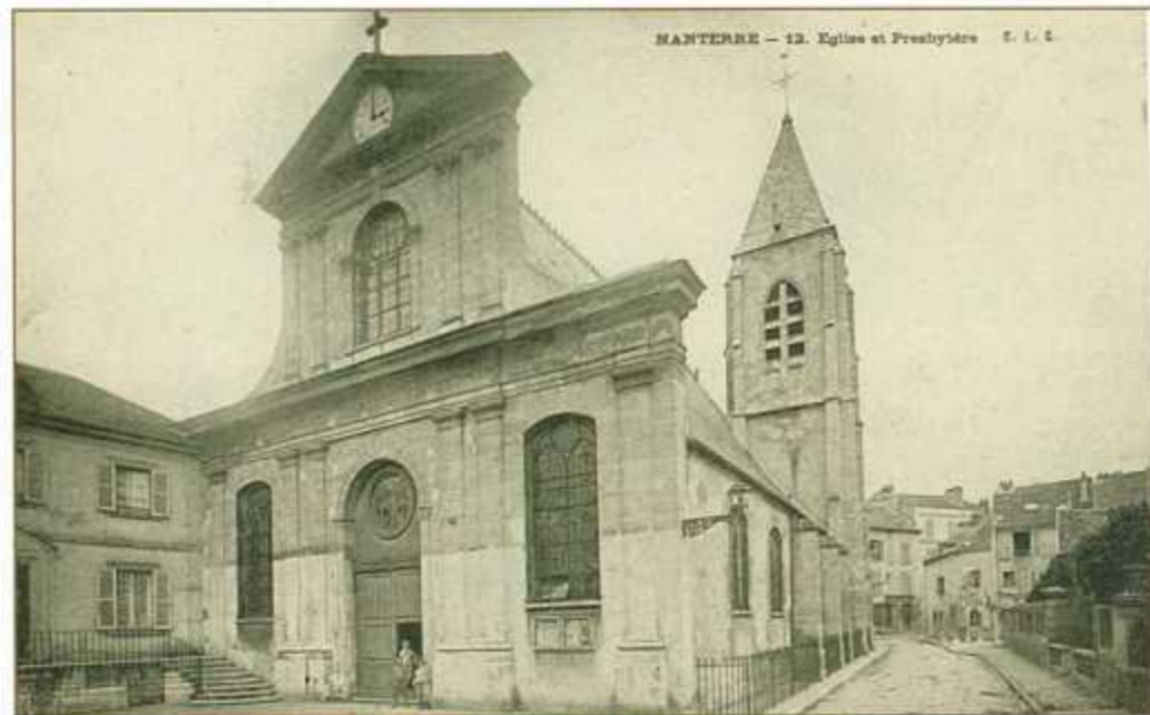
L'église avec son ancienne façade, construite en 1699 et démolie en 1972.