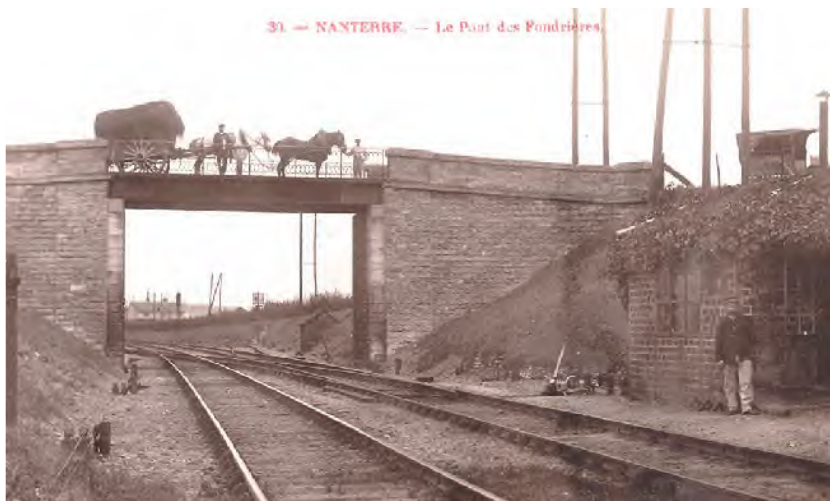
■ Le pont dit de La Folie lors de sa création, est appelé actuellement pont des Fondrières.

■ Un pont construit en bois, avec neuf arches de trente mètres d'ouverture permet de franchir la Seine ; côté Nanterre, il est nommé «pont des Anglais» et côté Bezons «pont de la Morue».