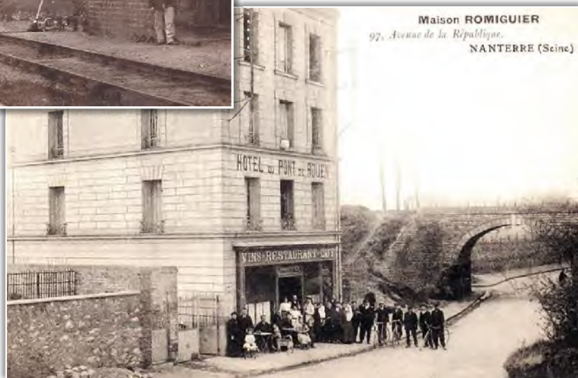
■ Le pont de Rouen vers 1900.