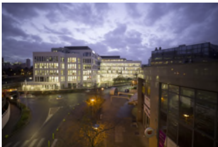
Image - mystère de février 2019. Où se trouve ce nouvel immeuble de bureaux ? Comment se nomme l'entreprise qui l'occupe principalement ?

Solution de l'image-mystère du mois de janvier 2019 Cette photo oblique représente l'état d'avancement du percement d'une partie de l'avenue Joliot-Curie en 1954. On y remarque le cimetière du Centre, sur la gauche, et, sur la droite, les terrains de sport Gabriel-Péri.