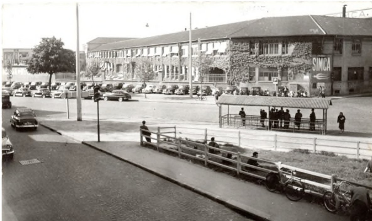
Hier : l'usine SIMCA à l'angle des avenues Félix-Faure et Georges-Clemenceau Aujourd'hui : le même endroit (photo Daniel Sollat 2019). Au fond, « le Capitole ».