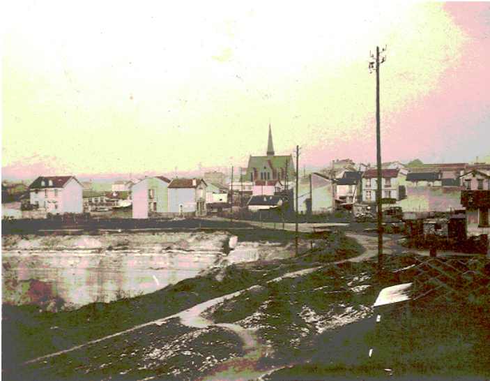
En 1940 (la carrière du Champ-aux-Melles)

Les carrières, la chapelle Saint-Joseph, le CNIT et la Défense, puis la Grande-Arche, le bidonville de la rue de la Garenne, la cheminée de la chaufferie ENERTHEM à Courbevoie, le parc André-Malraux, le groupe scolaire Pablo-Picasso et le stade Jean-Guimier, l'école d'architecture et les immeubles d'habitation de Jacques Kalisz et d'Emile Aillaud ... le quartier du Parc et ses repères ... pour aller depuis l'ancien quartier des Fontenelles jusqu'aux projets en gestation ..