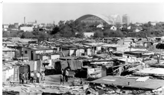
Bidonville de Nanterre