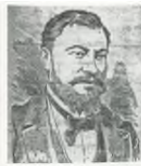
Portrait de M. Hennape, maire de Nanterre de 1881 à 1890, puis de 1896 à 1900.

A la fin du XIXe siècle un club, où se pratiquaient des sports comme la Gymnastique et le Tir, est créé à l'initiative du maire de Nanterre de cette époque.