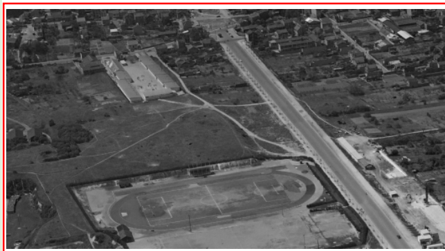
Fonds local et activités de la Société d'Histoire

Samedi 7 Mars 2020 à 18h00, salle de conférence du Lycée Joliot-Curie, 92, Avenue Frédéric et Irène Joliot-Curie NANTERRE. Association des anciens élèves (ANLYCE). Contact: anlyce2020@gmail.com . Programme détaillé à découvrir en cliquant sur l'image ci-dessous.