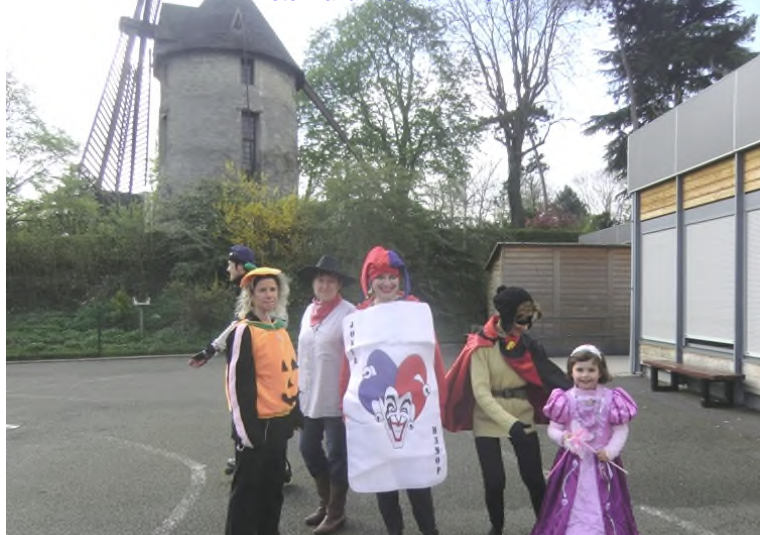
avril 2013

Pendant la guerre de 1870, l'emplacement du moulin constitue un bon observatoire et une redoute qui prend part aux combats, particulièrement pendant la bataille de Buzenval en novembre. C'est à cette époque de guerre que le moulin perd ses ailes, repères trop visibles et cibles parfaites.