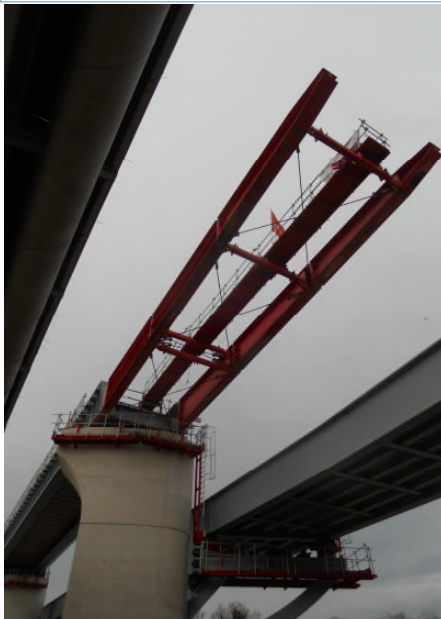
Image-mystère de ce mois. Quel est cet important chantier ouvert il y a déjà longtemps à Nanterre ? Où se situe-t'il ?

Solution de l'image-mystère de janvier 2021 A voir aussi sur notre site internet.