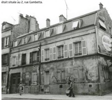
L'ancienne poste de Nanterre était située au 2, rue Gambetta.

La Poste de Nanterre a souvent changé de place: de la rue Gambetta au 19 ème siècle, à la rue du Marché au 20 ème siècle.