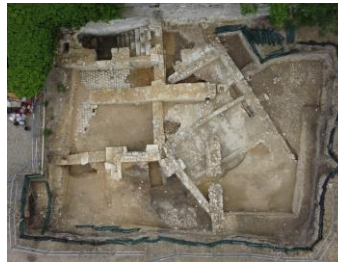
Vue aérienne du chantier de la fouille programmée au fond du parc des Anciennes-Mairies (2023) qui permet de visualiser les vestiges du Collège royal (17 e siècle) et dessous, à droite, les vestiges d'un habitat et d'une rue existant avant les expropriations effectuées par le père Beurrier pour édifier ledit collège.