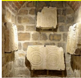
Panneaux de sarcophages conservés par la Société d'Histoire (fouille de la nécropole alentour et sous l'église de Nanterre).