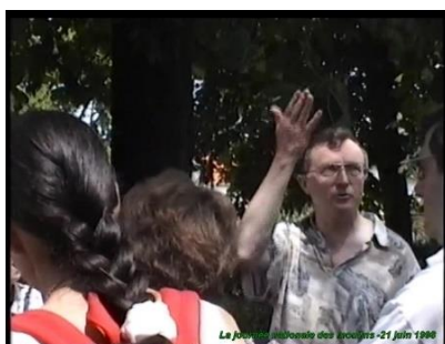
Juin 1998, au Moulin des Gibets, (journée nationale des moulins).