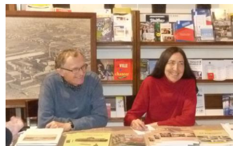
Novembre 2016, à l'Office de tourisme ; pour la quinzième des auteurs de la Société d'Histoire.