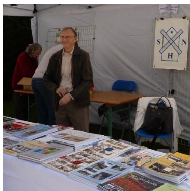
Mai 2014, sur le stand de la Société d'Histoire, au festival Ecozone .