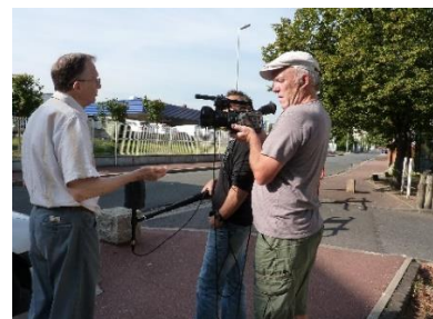
En 2012, lors d'un tournage de film documentaire au Petit-Nanterre.