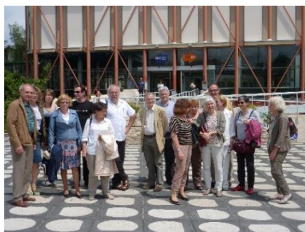
Juin 2014, à la BDIC (aujourd'hui La contemporaine).