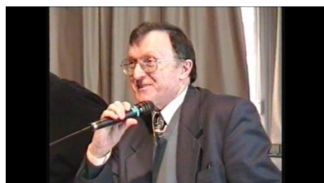
Février 1997, à la médiathèque Pierre-et-Marie Curie, lors d'une AG de l'association.