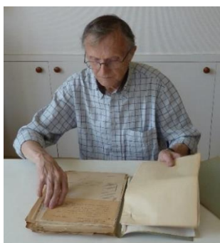
En 2013, à la Papeterie, lors du pré classement des archives de l'entreprise, avant leur transfert aux Archives départementales.