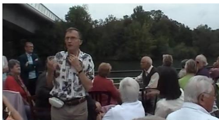
Septembre 2006, balade en péniche au large de l'Île Fleurie.