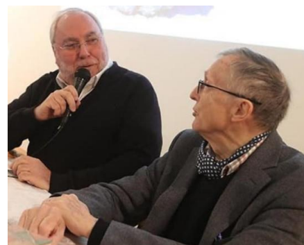
Janvier 2020, assemblée générale. Une complicité de plus de trente ans.