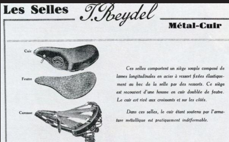
Les selles Reydel en cuir.