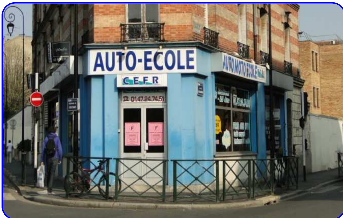
Hôtel du Départ à l'angle de la rue Stalingrad et du boulevard du Couchant