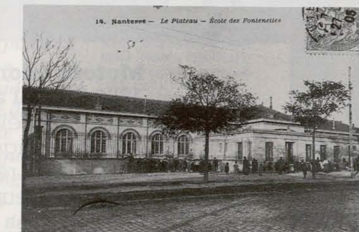
14. Nanterre — Le Plateau — École des Fontenelles