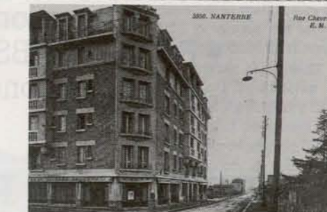
3050. NANTERRE — Rue Chevrolat — E. M.