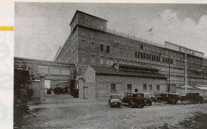
5934. NANTERRE — Usine Simca — E. M.

La vie des habitants de la rue et d'une grande partie du quartier est bouleversé en 1955 : l'EPAD, chargé de l'aménagement de La Défense envoie les premiers avis d'expropriation. Chacun est d'autant plus inquiet que le plan d'aménagement, très général, ne comporte aucune indication pour le relogement. Tous demandent des garanties sérieuses pour la