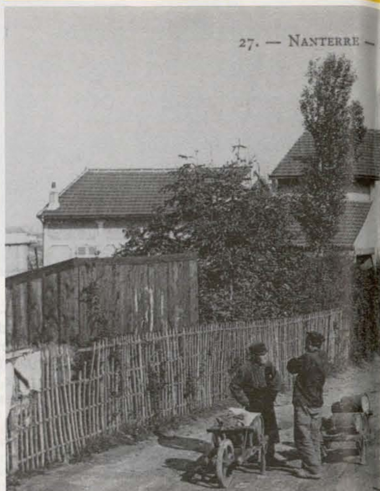
27. — NANTERRE — Rue des Fontenelles