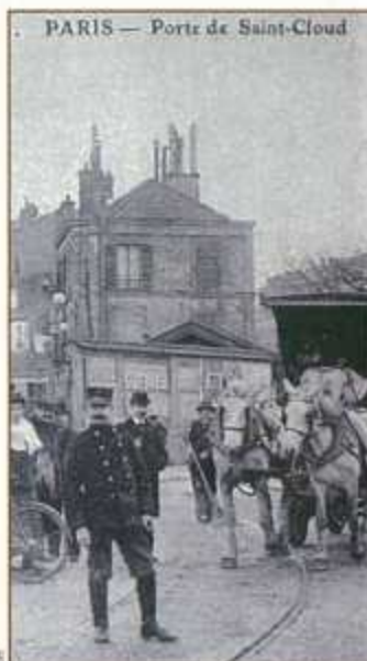
Uniformes des employés de l'oc

Le décret autorisant l'établissement de l'octroi paraît le 10 mai 1913. Le service est assuré par un préposé en chef, nommé par le préfet sur présentation du maire, un