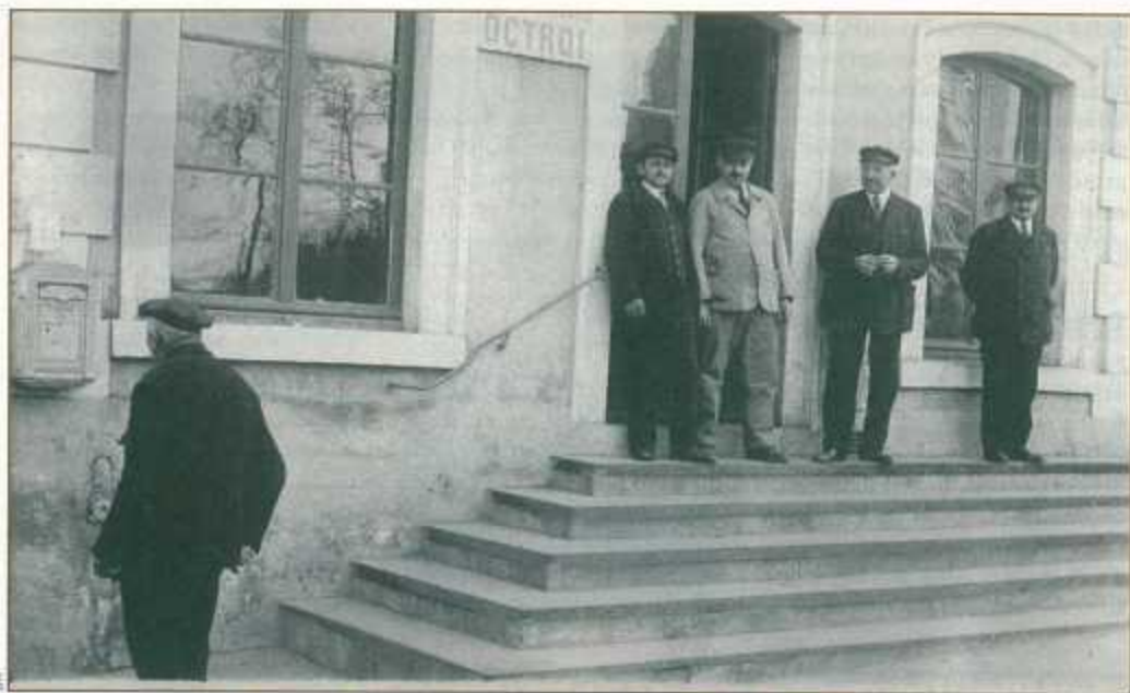
En 1931, un octroi est installé dans la salle d'attente de la gare de Nanterre.

la loi de 1918 conduisent le conseil à étendre les droits sur d'autres produits: les boissons et liquides, les comestibles, les combustibles, les fourrages. Trois nouveaux bureaux sont créés: un bureau au rond-point des Bergères (en remplacement du bureau mixte avec