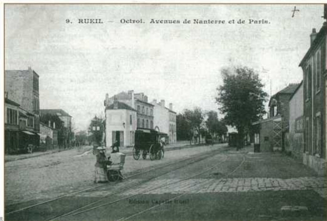
L'octroi mixte de Nanterre et Rueil à l'angle des actuelles avenues Paul-Doumer et Gabriel-Péri de Rueil.

surveillant et cinq agents municipaux. Les déclarations et les recettes des droits se font dans cinq bureaux : au bureau central à la mairie, dans deux bureaux mixtes avec Puteaux (au rond-point des Bergères et route du Havre), dans un bureau mixte avec Rueil (à l'angle de la route de Cherbourg et de l'avenue de Nanterre) et au bureau du Petit-Nanterre (en face de l'actuel hôpital Max-Fourestier). Ce dernier est une petite construction démontable, en fibrociment, d'une surface de 16 m 2 .