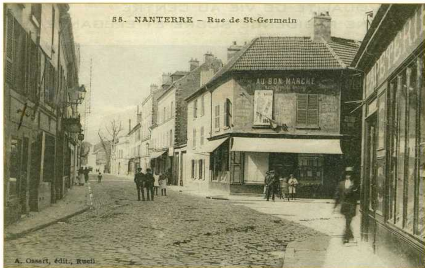
Le magasin de nouveautés en 1900.

Depuis plus de cent cinquante ans, parmi les commerces de proximité installés dans le centre historique de Nanterre, l'actuel magasin Nicolas, autrefois magasin de nouveautés, est particulièrement bien situé.