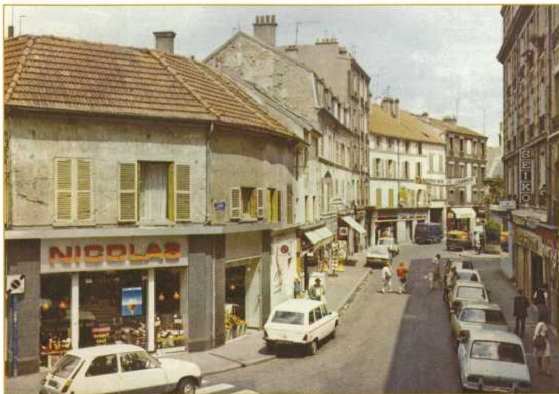
Le magasin Nicolas vers 1970.

pendant tout le mois de décembre, distribution de jolis calendriers (art nouveau) ou de superbes primes à tout achat dépassant trois