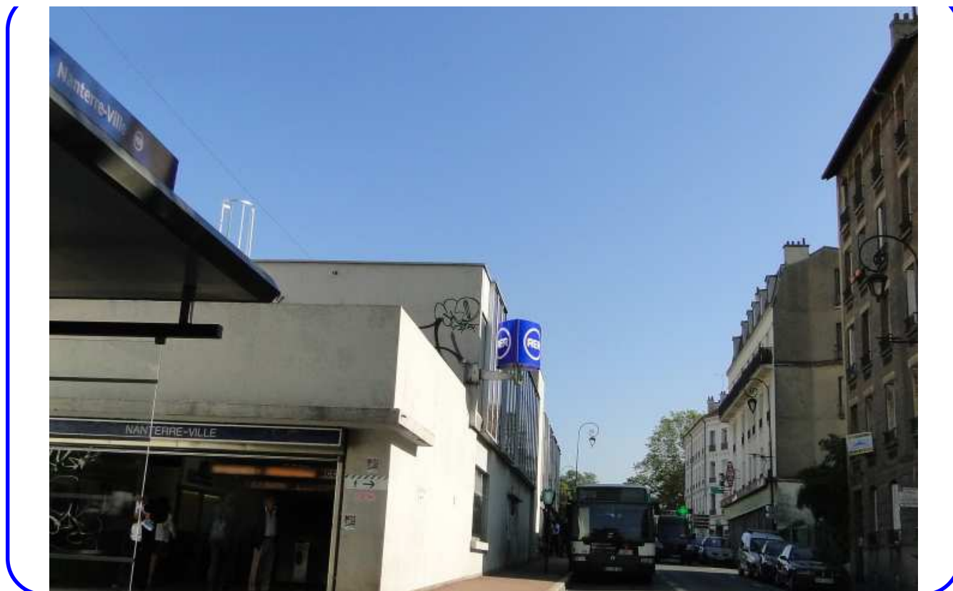
Boulevard du Couchant, descente de la Gare au début du XX e siècle Mêmes lieux (gare RER Nanterre-Ville) en 2013