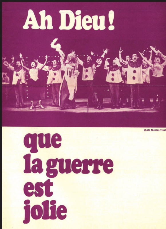
L'affiche de la reprise du spectacle en 1972.