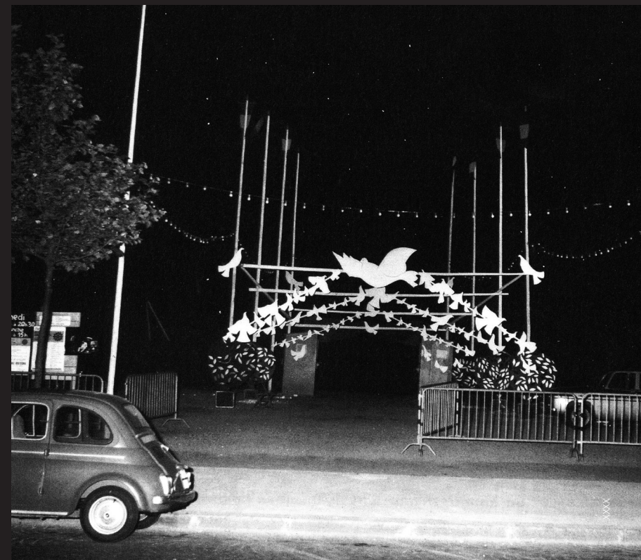
L'entrée du deuxième festival, rue de Rouen (in bull. n° 41 de la SHN).