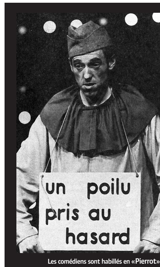
Les comédiens sont habillés en «Pierrot».

Erratum: Dans le deuxième article sur la machine de Marly, paru au mois de mai, les légendes de la carte de l'abbé de la Grive (XVIII e siècle) et du croquis du XVII e siècle ont été malencontreusement inversées; nous prions nos lecteurs de bien vouloir nous en excuser.