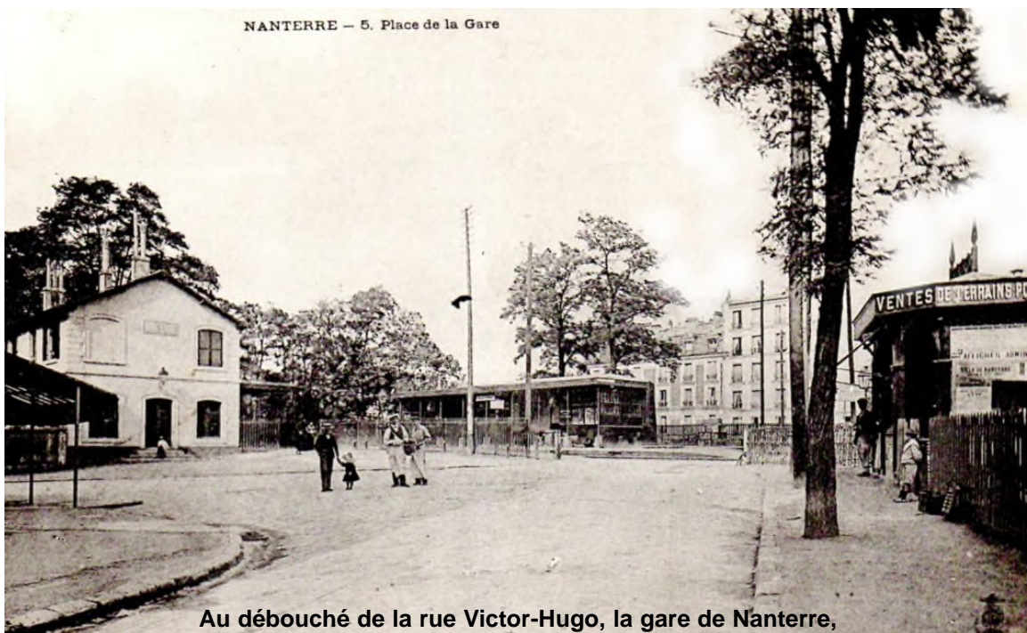
Au débouché de la rue Victor-Hugo, la gare de Nanterre, au début du XXe siècle (carte postale) et aujourd'hui.