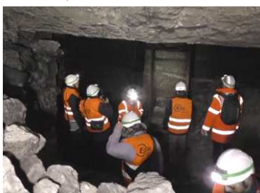
Balade dans la carrière de la Folie, rue Hanriot, le 24 janvier 2018.

La Société d'Histoire s'est adressée au président de l'Etablissement public local « Paris-La-Défense » pour l'alerter sur la nécessaire sauvegarde de la Carrière de la Folie, dont le périmètre est inclus dans le secteur d'aménagement du quartier des Groues (anciens terrains de la SNCF). Voir sur notre site Internet les articles témoignant de cette activité si importante à Nanterre .