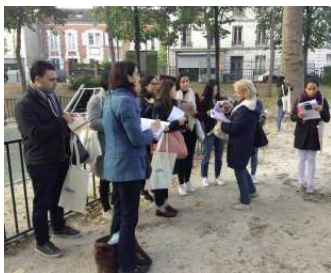
Balade dans Nanterre pour les étudiants étrangers de l'université, le 19 octobre 2018

Toujours avec l'université, en lien avec le service enseignement de la ville, le CESI et l'AFEV, nous accompagnons, le 29 mars prochain, une balade dans Nanterre pour les étudiants étrangers . Vous pouvez vous joindre au groupe, surtout si vous parlez une ou plusieurs langues ; le rendez-vous est fixé à 9 h 30, à la Villa des Tourelles .