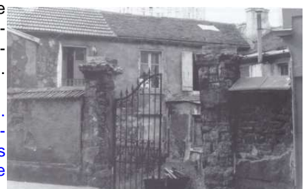
La « maison des voleurs », 247 avenue Clemenceau en 1975.