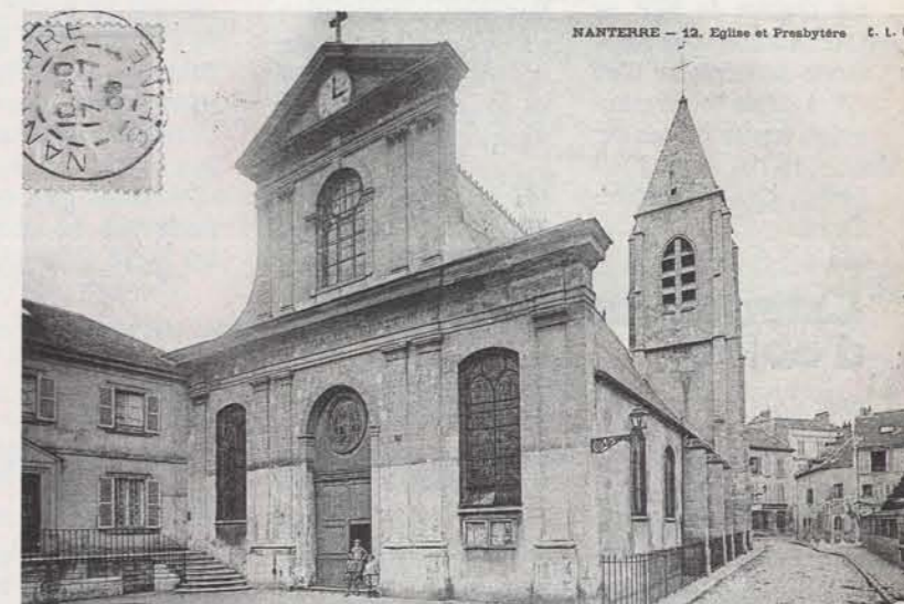
« ... Les habitants (les propriétaires) de Nanterre se réunissent à l'issue de la messe afin de donner leur avis sur la conduite des affaires de la communauté... »

Partout en France et encore aujourd'hui en de nombreux endroits, l'eau - sa capture, sa possession, son usage - a été le centre d'enjeux vitaux, économiques et politiques. Lionel Ray raconte... Rue de la Source, avenue Fontaine de Rolle, puits Sainte-Geneviève, à Nanterre, aux XVIII e et XIX e siècles.