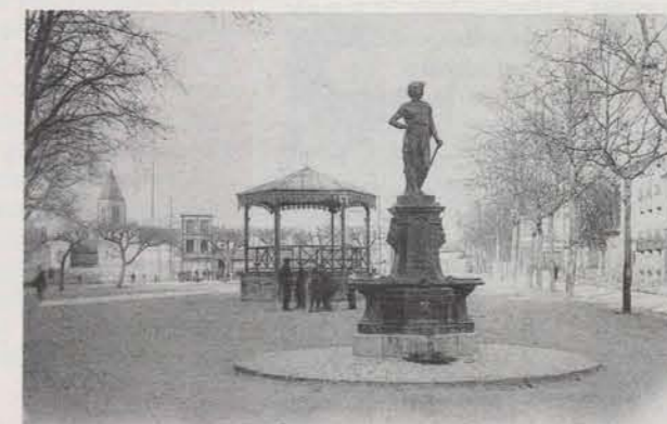
Fontaine de la place de la Fête (aujourd'hui la place du Marché)