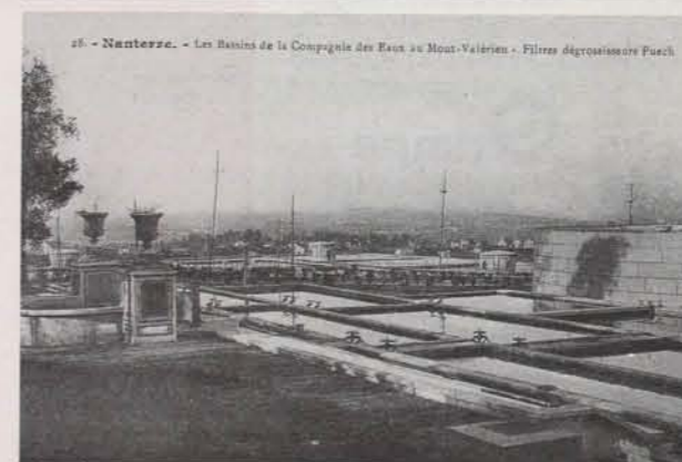
Les réservoirs de la Compagnie des Eaux au Mont-Valérien