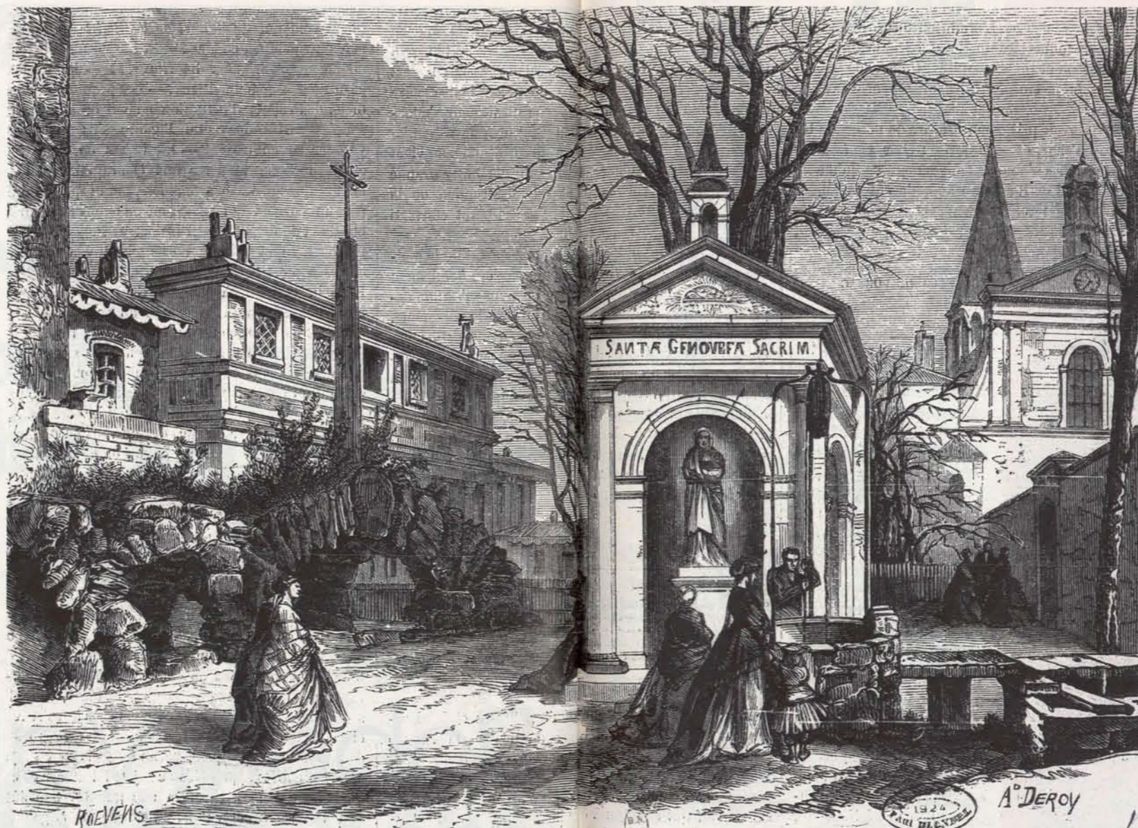
La neuvaine de Sainte-Geneviève, patronne de Paris. — Le puits et la chapelle de Sainte-Geneviève à Nanterre.

« LES SOURCES ET LES FONTAINES DU BOURG DE NANTERRE AUX XVIII e -XIX e siècles. » Conférence de Lionel Ray Salle polyvalente de la Bibliothèque Pierre et Marie Curie Place de l'Hôtel de Ville Le 23 novembre 1991 à 17 h