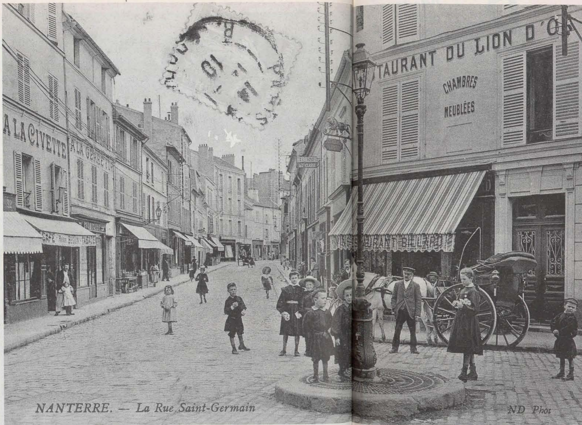
NANTERRE. — La Rue Saint-Germain

On sait que Sainte-Geneviève rendit la vue à sa mère aveugle en lui passant de l'eau tirée de son puits sur les yeux. Depuis, si l'on en croit la tradition, l'eau miraculeuse accomplit d'autres miracles notamment en ophtalmologie. Le philosophe de la Renaissance, Erasme, y eut recours et fut guéri ainsi que l'indique le poème qu'il composa pour célébrer l'événement. En 1636, Anne d'Autriche vint boire l'eau du puits qui avait la vertu de favoriser les naissances. On ignore si c'est ce pèlerinage ou l'un des nombreux autres qu'elle fit, qui fut efficace mais Louis XIV naquit en 1638. Cette eau accomplissait tous les prodiges puisqu'elle fit merveille pour les cheveux du Marquis de Soubise en 1590. L'histoire rapporte même qu'elle fit effet sur un huguenot de la suite du marquis ce qui est une preuve d'écuménisme à une époque peu tolérante.